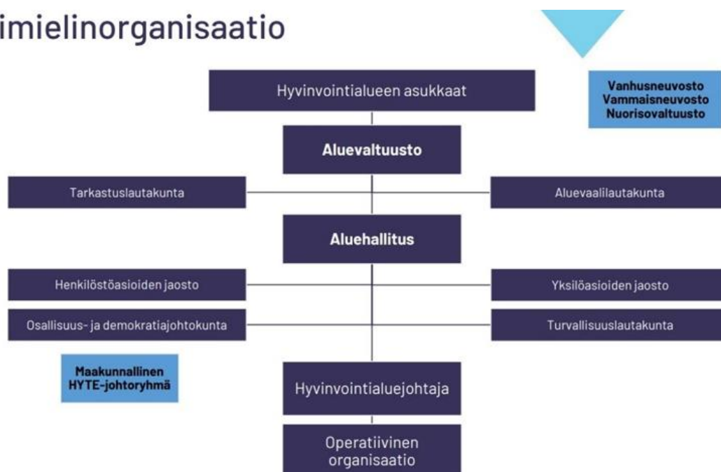
Kuvio 1. Etelä-Karjalan hyvinvointialueen organisaatiokaavio 2025.

Hyvinvointialueella hyväksyttiin vuoden 2025 lopulla hallintosäännön päivitys, sekä johtamisjärjestelmän muutos, jotka tulivat voimaan 1.1.2026. Uudessa johtamisrakenteessa selkeytetään vastuita asiakkaan näkökulmasta. Hyvinvointijohtajan alaisuuteen perustettiin sotetoimialue, joka koostuu episodipalveluista, erikoissairaanhoidonpalveluista ja pitkäaikaispalveluista.