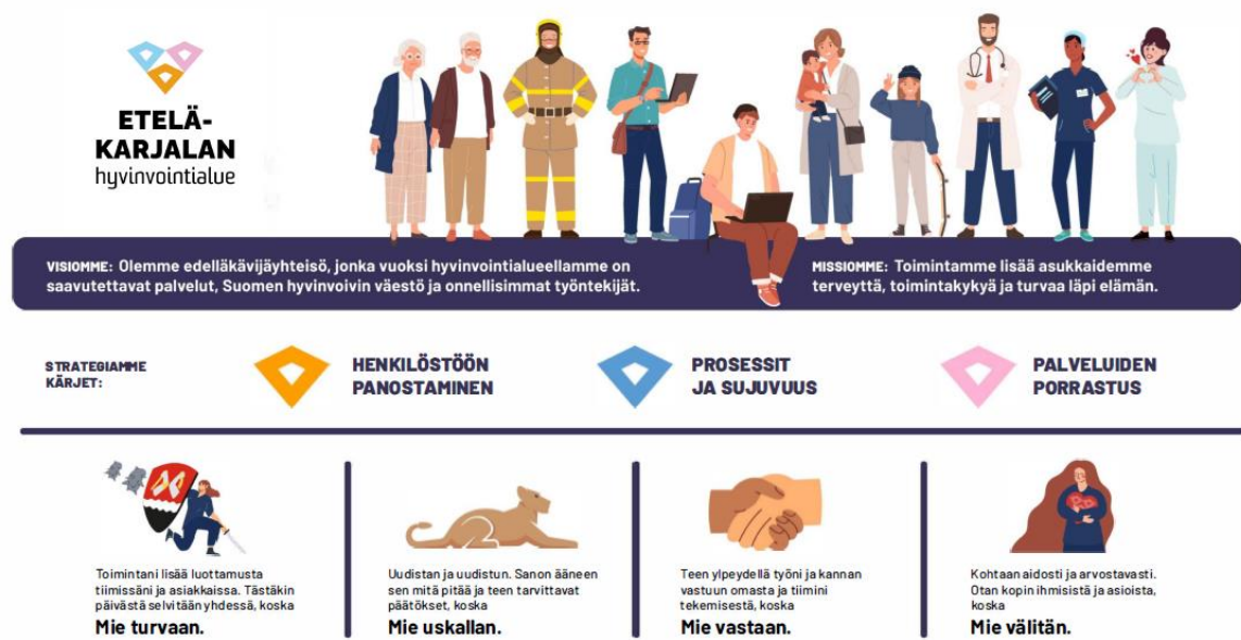
Kuvio 2. Etelä-Karjalan hyvinvointialueen strategia 2022–2025 kuvana.

Aluevaltuusto on marraskuussa 2025 hyväksynyt päivitetyn strategian vuosille 2025–2029. Strategian uuden kärjet ovat ”Kohtaavat ja vaikuttavat palvelut” ja ”Osaava ja motivoitunut etujoukkue”.