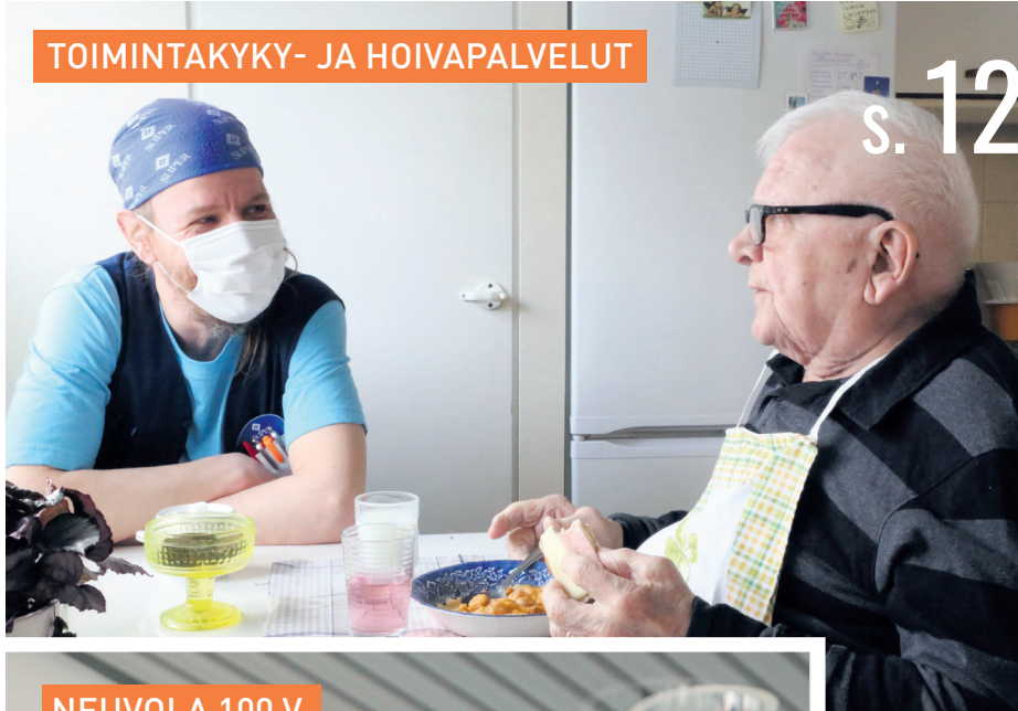
TOIMINTAKYKY- JA HOIVAPALVELUT