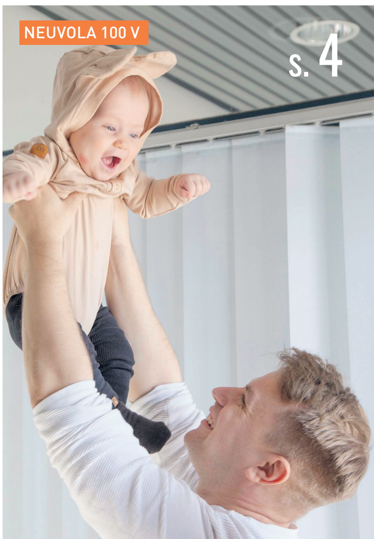
NEUVOLA 100 V